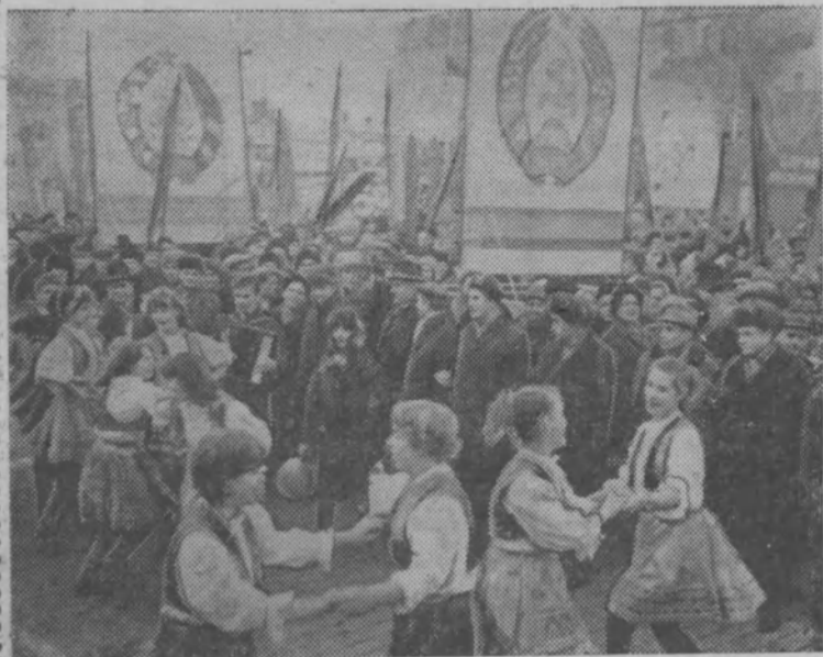
На снимке: демонстрация представителей трудящихся на Красной площади.