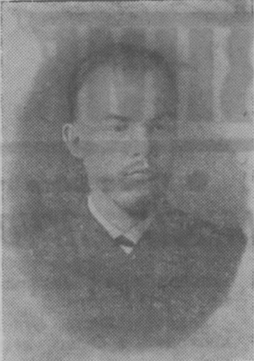
На снимках: фотокопия диплома первой степени, выданного В. И. Ленину Петербургским университетом в январе 1892 года. В. И. Ленин в студенческие годы. Самара, 1890 г.