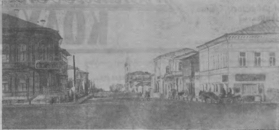
Самара (ныне г. Куйбышев). Дворянская улица. Эта улица тесно связана с Самарским периодом жизни и деятельности Ильича. Здесь располагался Самарский окружной суд, где работал Ленин.