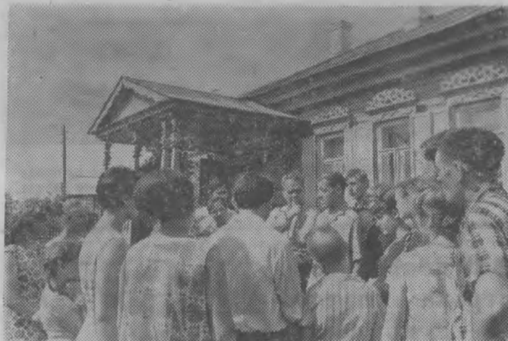
Куйбышевская область. Экскурсанты около Дома-музея В. И. Ленина в селе Алакаевке. Здесь семья Ульяновых жила в летние месяцы 1889—1893 годов.