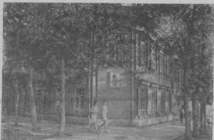
Куйбышев. Дом на углу улиц Ленинской и Рабочей (бывших Сокольничьей и Почтовой). Здесь сейчас находится Дом-музей В. И. Ленина. В этом доме в 1890—1893 годах жила семья Ульяновых.