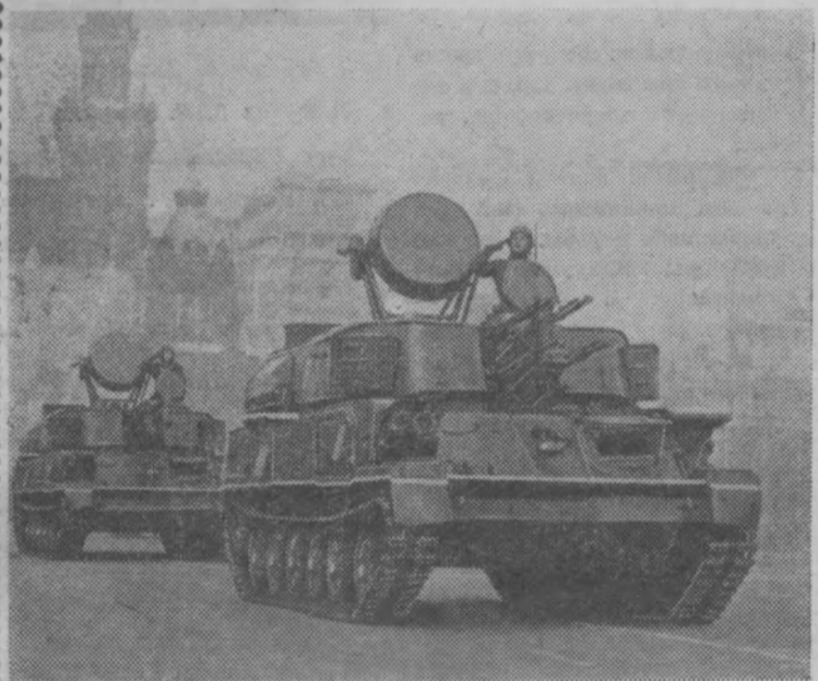
Парад войск Московского гарнизона на Красной площади. На снимке: зенитные установки сухопутных войск на параде.