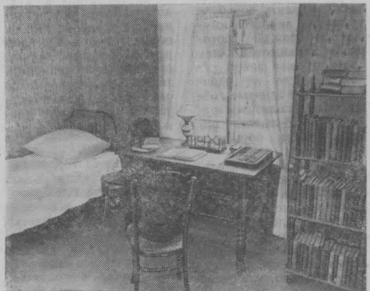
Куйбышев. Комната Владимира Ильича в Доме-музее В. И. Ленина. В этом доме семья Ульяновых жила в 1889—1893 г.