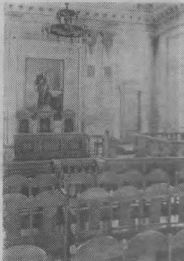
Куйбышев. Зал суда, где выступал В. И. Ленин. В январе 1892 года он был зачислен помощником присяжного поверенного при Самарском окружном суде.

Самарский период был периодом накопления сил для дальнейшей борьбы. В августе 1893 года Владимир Ильич переезжает в Петербург — крупный промышленный центр, где были сосредоточены большие массы пролетариата.