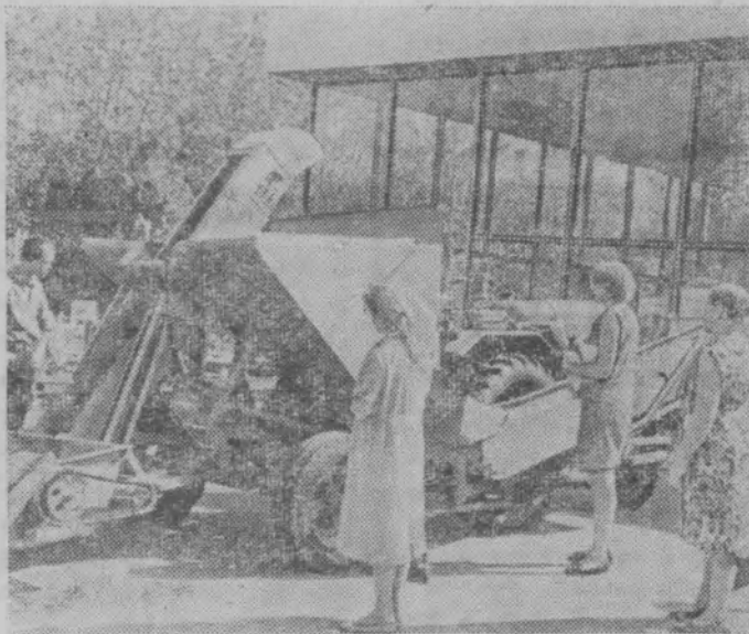
Москва. На Выставке достижений народного хозяйства СССР организован смотр работ сельских изобретателей и рационализаторов, на котором представлено около 700 экспонатов.

На снимке: посетители осматривают загрузчик минеральных удобрений в самолеты, сконструированный специалистами Пуховского отделения «Сельхозтехники» Лискинского района Воронежской области. Загрузчик навешивается на раму трактора «ДТ-20». Емкость бункера — полторы тонны. Время загрузки 3—4 минуты. Эта установка заменяет труд 20 человек.