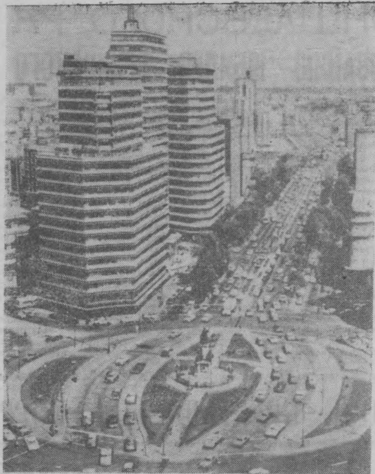
На снимке: столица Мексики — Мехико. Вид на площадь Колумба и улицу Пасео-де-ла-Реформа.