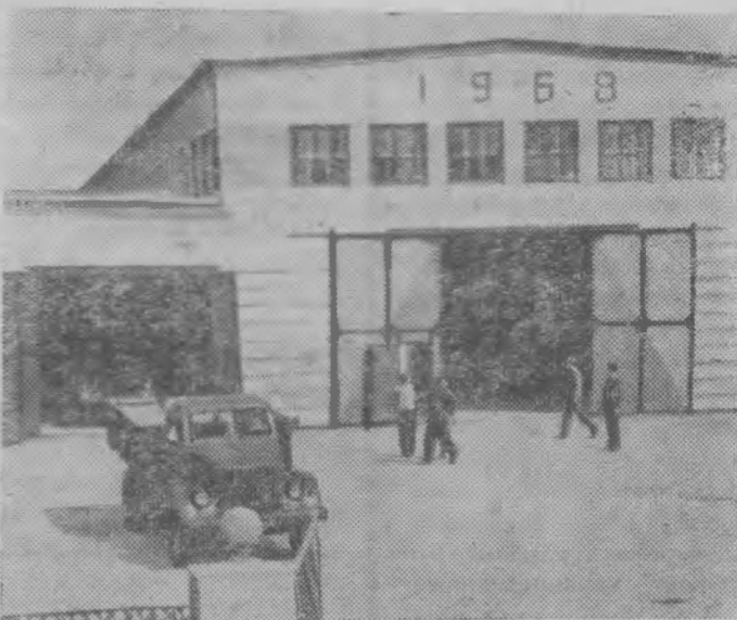
Хмельницкая область. Механизаторы и инженеры «Сельхозтехники» Волочисского района своими силами построили и досрочно ввели в эксплуатацию станцию технического обслуживания колхозных автомобилей. На станции два цеха. В одном, где установлены конвейерные линии, осуществляется технический уход за автомобилями, а второй зал предназначен для заявочного ремонта.

На снимке: посетители осматривают загрузчик минеральных удобрений в самолеты, сконструированный специалистами Пуховского отделения «Сельхозтехники» Лискинского района Воронежской области. Загрузчик навешивается на раму трактора «ДТ-20». Емкость бункера — полторы тонны. Время загрузки 3—4 минуты. Эта установка заменяет труд 20 человек.