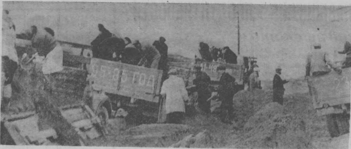
На строительстве трассы Тоншаево—Шайгино. Десятки людей и машин было сосредоточено здесь на последнем субботнике. В результате на дорогу вывезено около 550 кубометров песка.