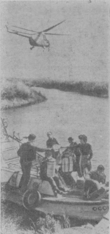
Геологическая партия в дельте Дуная. За последние годы румынские геологи открыли много новых месторождений полезных ископаемых: нефть, уголь, железную руду, цветные металлы.