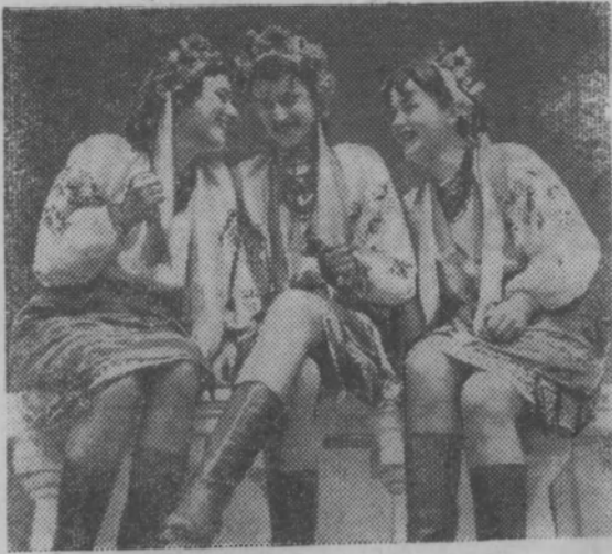
ВИННИЦКАЯ ОБЛАСТЬ. Выступления танцевального ансамбля Ильинецкого районного Дома культуры пользуются неизменным успехом у зрителей.