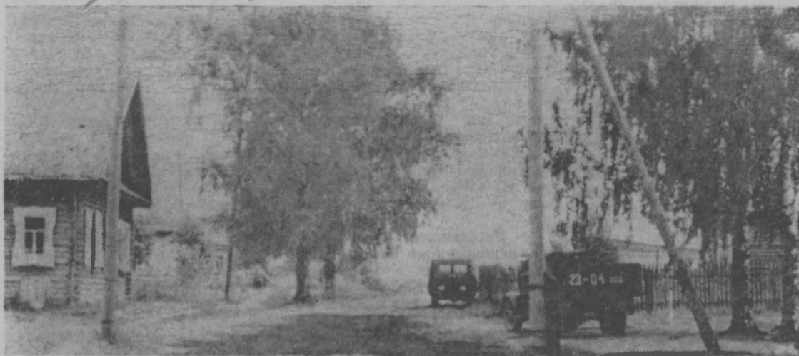
Уголок Тоншаевской районной больницы.

Исполком облсовета исполкому Тоншаевского райсовета присудил переходящее Красное знамя и выдал премию в сумме 5 тысяч рублей. Деньги пойдут на благоустройство райцентра и социально-культурные мероприятия.