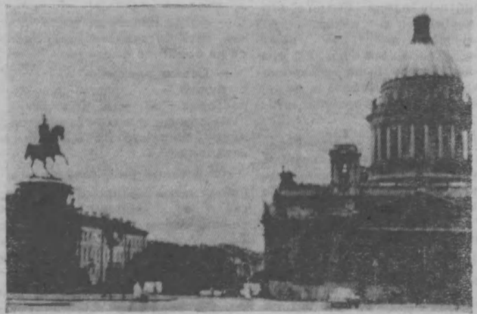
На снимках: 1. Дворцовая площадь. 2. Исакиевский собор.