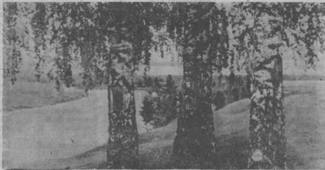
Шумят березы над рекой.