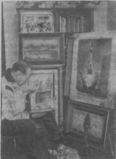
На снимке: Алексей Леонов у себя дома за работой над новой картиной.

В настоящее время А. Леонов продолжает работу над картинами космического цикла, связанными с космическими кораблями «Восток» и «Восход», а также над лунным циклом картин как «Затмение Солнца на Луне», «Восход Солнца на Луне» и другими картинами.