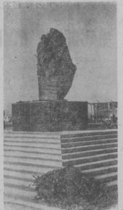
● ИРАН. Близ города Исфаган состоялась закладка первого в стране металлургического завода, который будет сооружен при техническом содействии Советского Союза. В честь этого события в центре строительной площадки, на гранитном постаменте воздвигнут 35-тонный монолит железной руды, под которым заложена золотая плита.

На снимке: 35-тонный монолит железной руды—символ советско-иранской дружбы.