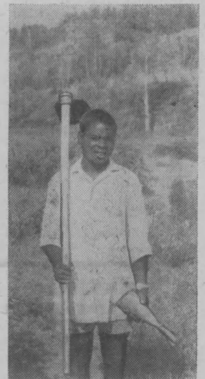
● Руандийская республика—небольшое центральноафриканское государство с населением немногим более трех миллионов человек. Более 90 процентов ее населения занято в сельском хозяйстве.

На снимке: 35-тонный монолит железной руды—символ советско-иранской дружбы.