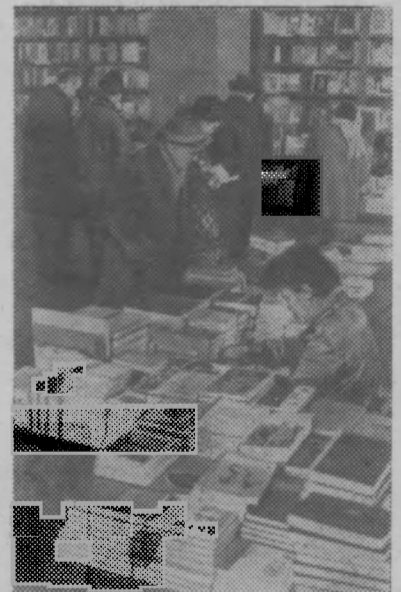
● БОЛГАРИЯ. В книжном магазине на Русском бульваре в Софии всегда толпится народ. Здесь представлен богатый выбор художественной, политической и технической литературы советских авторов и русских классиков.