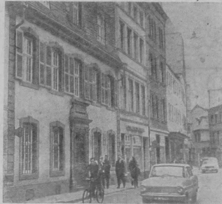
● Дом номер 10 (крайний слева) по улице Брюккентрассе в старинном немецком городе Трире, где 5 мая 1818 года родился Карл Маркс.

В 1867 году вышел в свет первый том книги Маркса