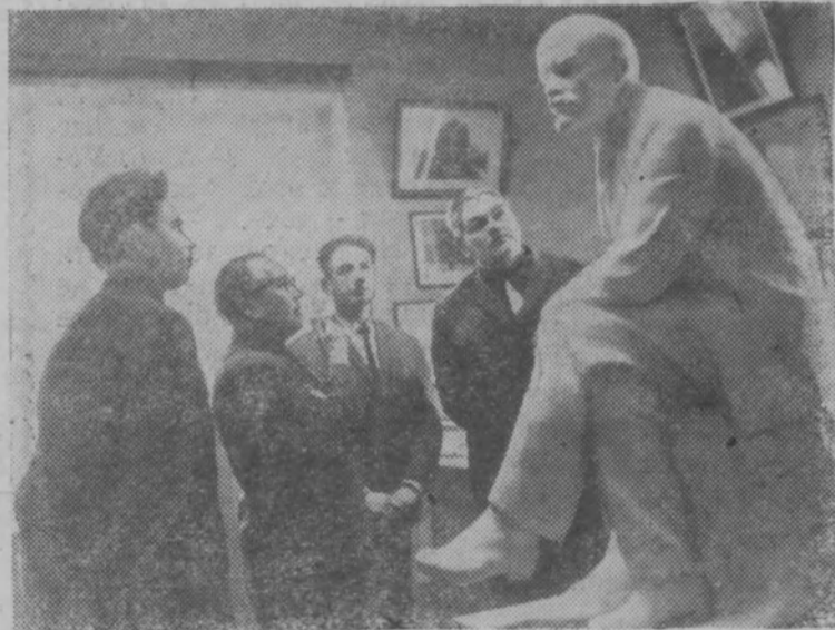
Ульяновск. Накануне 98-летия со дня рождения вождя пролетариата особенно много экскурсантов в комнатах Дома-музея В. И. Ленина и в залах Ульяновского филиала Центрального музея В. И. Ленина.

На снимке слева: экскурсанты в одном из залов Ульяновского филиала Центрального музея В. И. Ленина.