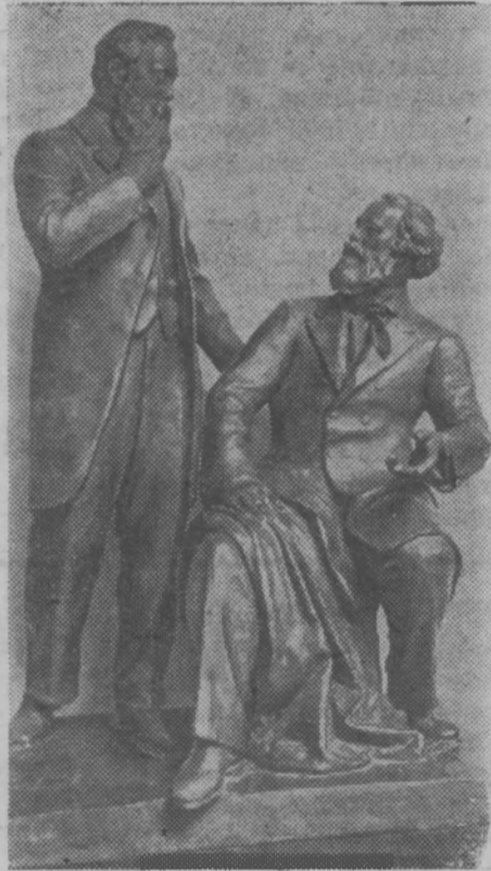
Карл Маркс и Фридрих Энгельс (работы скульпторов С. Алешина и М. Ласточкина).

живали революционное народничество в России. Маркс восторгался мужеством и самоотверженностью народолюбцев, их борьбой против царского самодержавия. Одновременно Маркс подчеркивал незрелость идеологии революционного народничества, которая объяснялась сравнительно невысоким уровнем общественно-политического развития России. Он стремился облегчить русским революционерам поиск правильного мировоззрения и тактики.