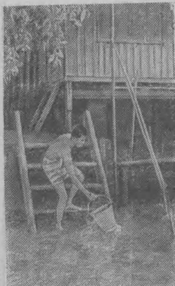
Жизнь миллионеров тайландцев проходит на берегах рек и каналов. Прямо в лодках и домах на сваях живут рыбаки и грузчики со своими семьями.

Воздействие радиопередачи «В Езёранах» на польское село огромно. Об этом свидетельствуют «клубы друзей Езёран», открытые в сотнях сел Народной Польши. Каждая передача способствует развитию культуры и просвещения в сельской местности, приносит конкретный результат; по инициативе крестьян сооружаются водопроводы, возводятся школы, обучаются кадры механизаторов сельского хозяйства, делается все, чтобы, как говорят поляки, «деревня жила и развивалась, а не прозябала».