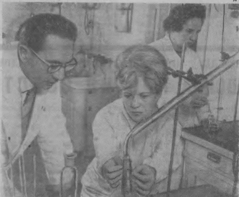
На снимке: в биохимической лаборатории института.