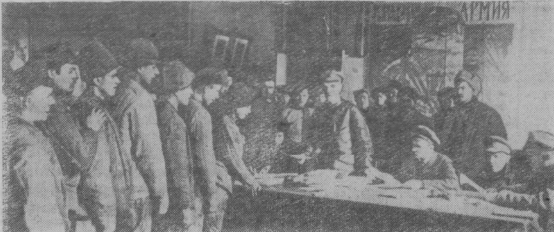
● На снимке сверху: раздача анкет при приеме в Красную Армию. 1918 г. ● На снимке слева: Рогожско-Симоновский полк, сформированный из рабочих Москвы, перед отправкой на фронт. (Красная площадь. 1918 год).