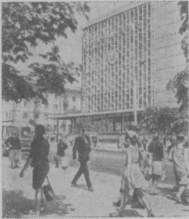
Кишинев. На проспекте Ленина.