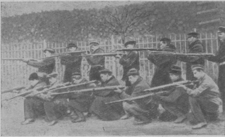
1917 год. Обучение отряда Красной гвардии у Смольного.