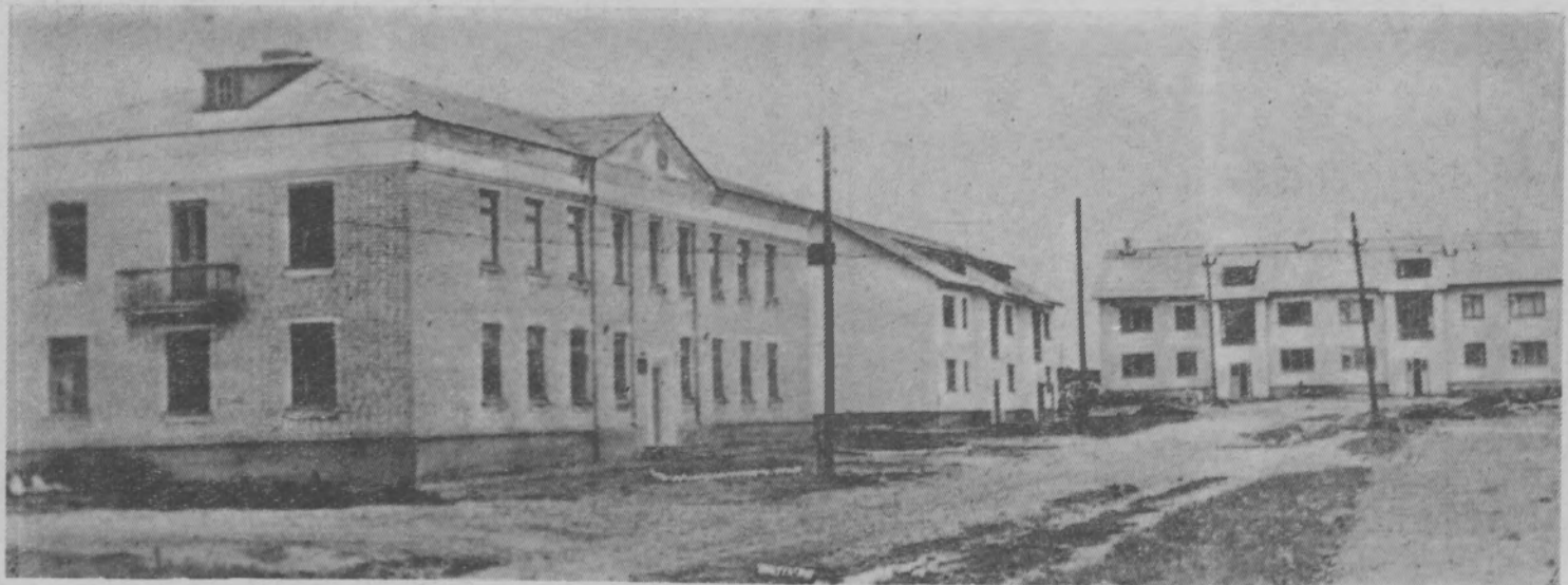
Новые дома на площади Мира села Тоншаево.