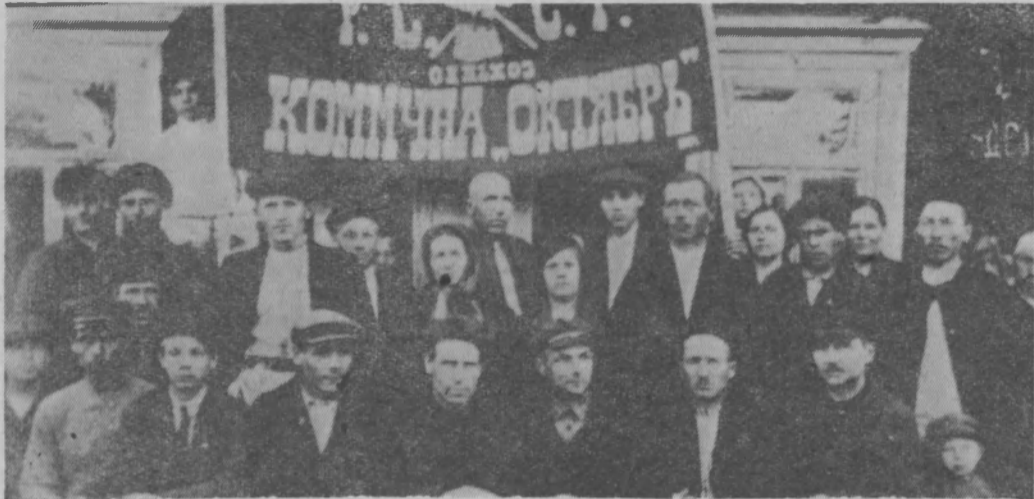
Этому снимку 37 лет. Тут ветераны-организаторы колхоза «Коммунар». Они были первыми зачинателями объединения крестьян деревни Евстропово для совместной обработки земли. Тогда это была коммюна «Октябрь».

Об этом и рассказывается ниже на страницах нашей газеты.