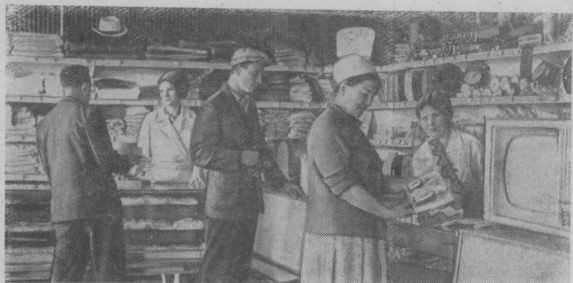
В магазине деревни Карамышево (Тульская область) можно приобрести все необходимое.