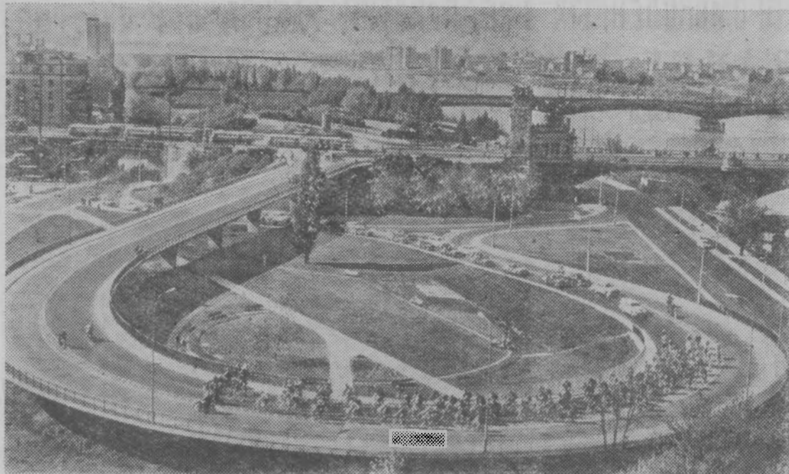
Польская Народная Республика. Варшава сегодня. Въезд на мост Понятовского.

В этот день в 1944 году на- чалось освобож- дение Польши от фашистских захватчиков