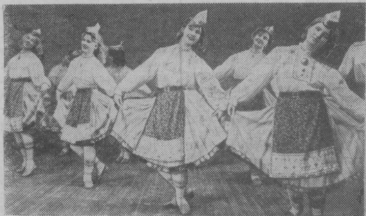
ТАЛЛИН. Дворец культуры имени М. Томпа. На снимке: женский ансамбль народного танца «Куллакстрайд» ренетирует «Танец молодых рыбаков».