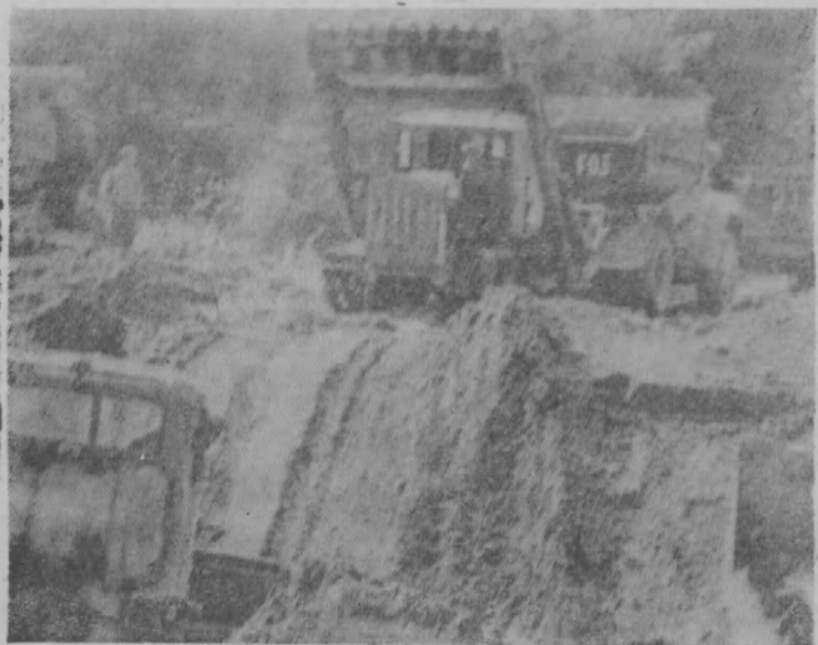
В карьере. Идет погрузка песка.