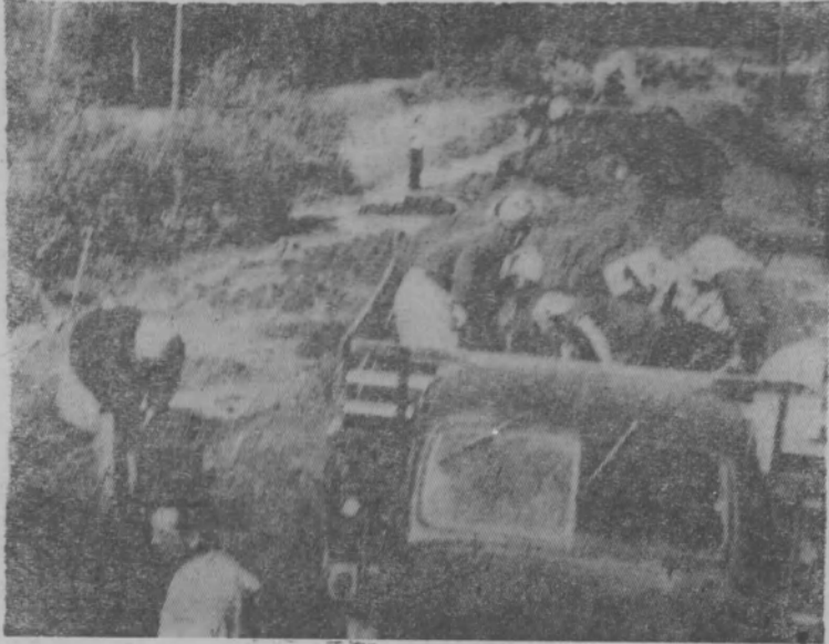
На дороге с. Тоншаево — и. Шайгино