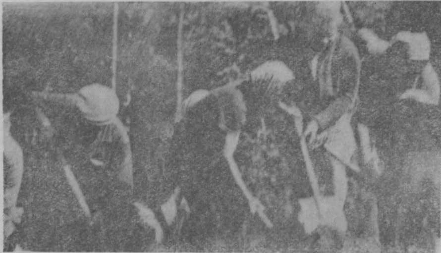
Участники воскресника за работой.