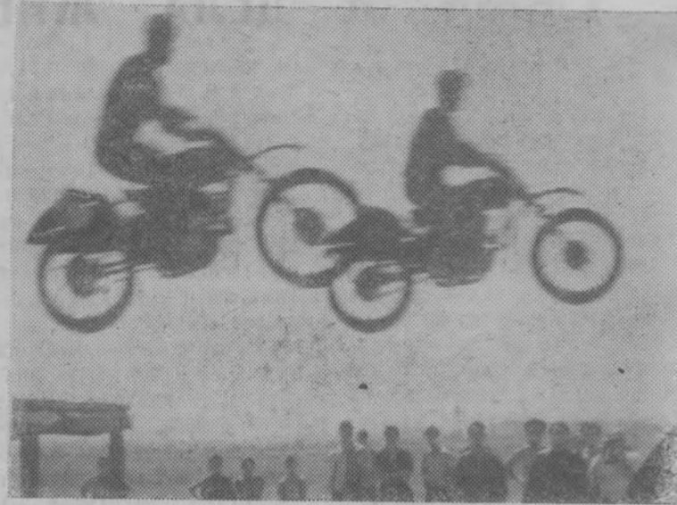
В. Хухлаев «Спорт смелых».