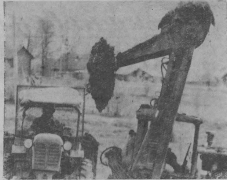
Удобрить землю как можно лучше, — так записано в обязательствах полеводов колхоза «Путь к коммунизму». В эти дни на вывозке местных удобрений механизаторы используют всю технику. Они уже очистили от навоза животноводческие помещения. Сейчас занимаются вывозкой торфа. На снимке: погрузка торфа.