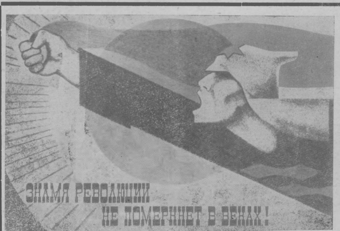
Плакат, выпущенный издательством „Советский художник“ к 50-летию Советской власти.

Ударникам коммунистического труда предоставляются преимущества при распределении жилой площади, путевок в санатории и дома отдыха и другие меры поощрения, установленные на предприятии. Они в первую очередь направляются по путевкам колхозов, совхозов и других предприятий на учебу в высшие и средние учебные заведения.