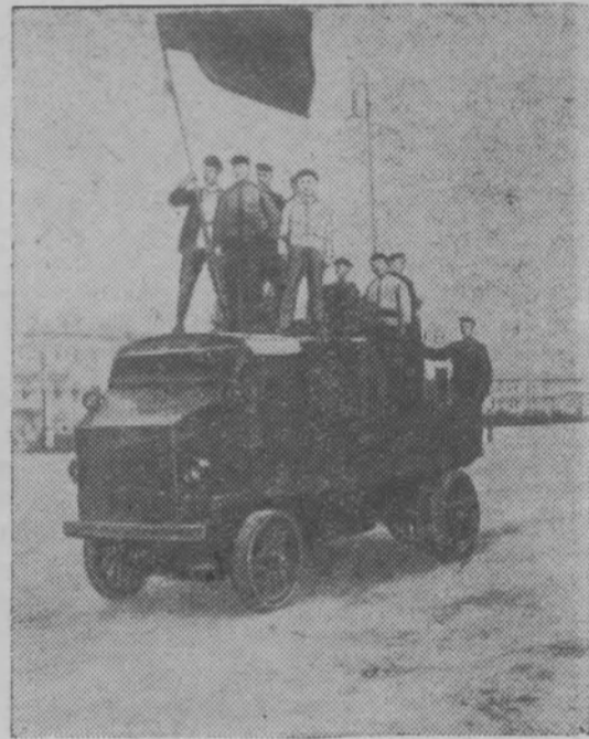
Красногвардейцы на Красной площади в Москве. 1917 год.