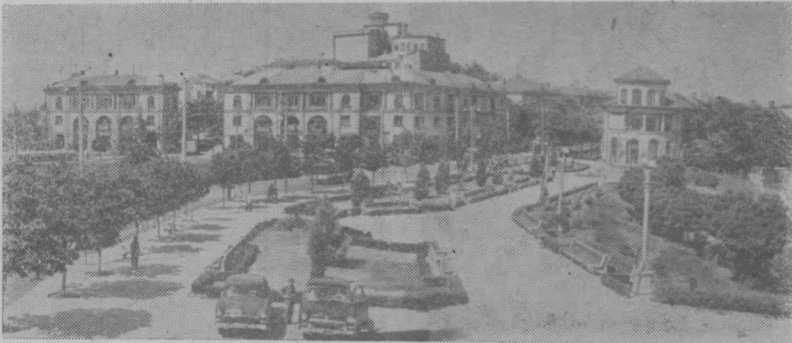
Город-герой Севастополь. Площадь Ушакова.