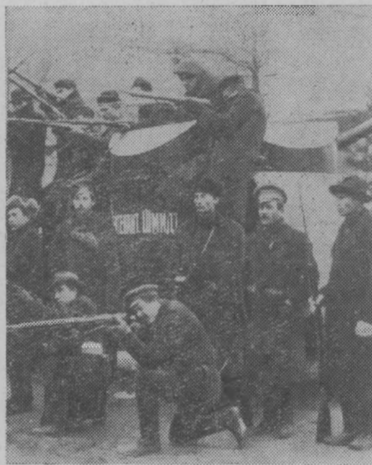
Петроград. Рабочие, отбившие у войск Керенского броневагон «Лейтенант Шмидт». Октябрь 1917 год.