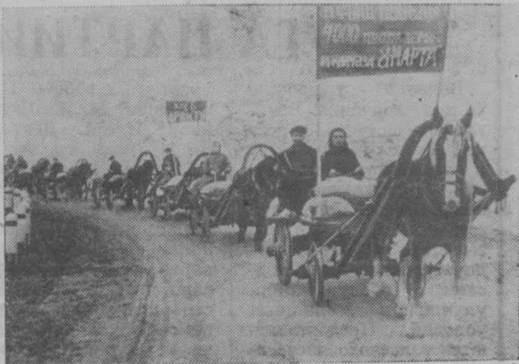
1944 год. Ярославская область. Хлеб—фронту.

Родина по достоинству оценила подвиги своих сынов и дочерей. Более семи миллионов человек были за годы войны награждены орденами и медалями. 11.527 самых храбрых воинов стали Героями Советского Союза, из них 104—дважды, а Маршал Советского Союза Г. К. Жуков, полковник А. И. Покрышкин и майор И. П. Кожедуб—трижды.