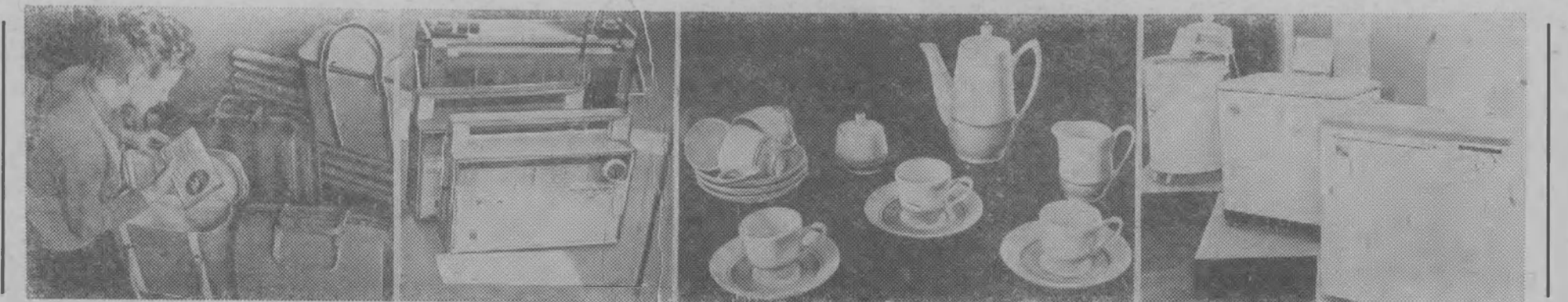
Почти 6 тысяч образцов новых товаров народного потребления внедряются в производство в юбилейном, 1967 году. На снимках (слева направо): сумки-холодильники (выпускаются в Горьковской области), переносный радиоприемник «Меридиан» (Киев), кофейный сервиз (Ереван), стиральные машины (Кишинев, Москва).