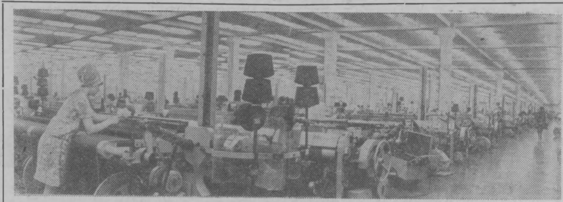
Иваново. Ткацкий цех камвольного комбината.

С такого низкого уровня первая страна социализма начала свою борьбу за повышение жизненного уровня народа.