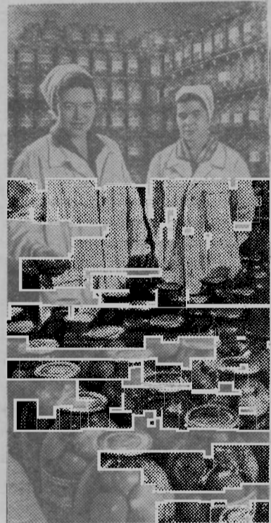
Мценск. Консервный завод. Здесь вырабатывают более 50 видов овощных и фруктовых консервов.

Не лучше было положение и с продукцией пищевой промышленности — сахаром, кондитерскими изделиями, консервами и т. д. Сахара, на-