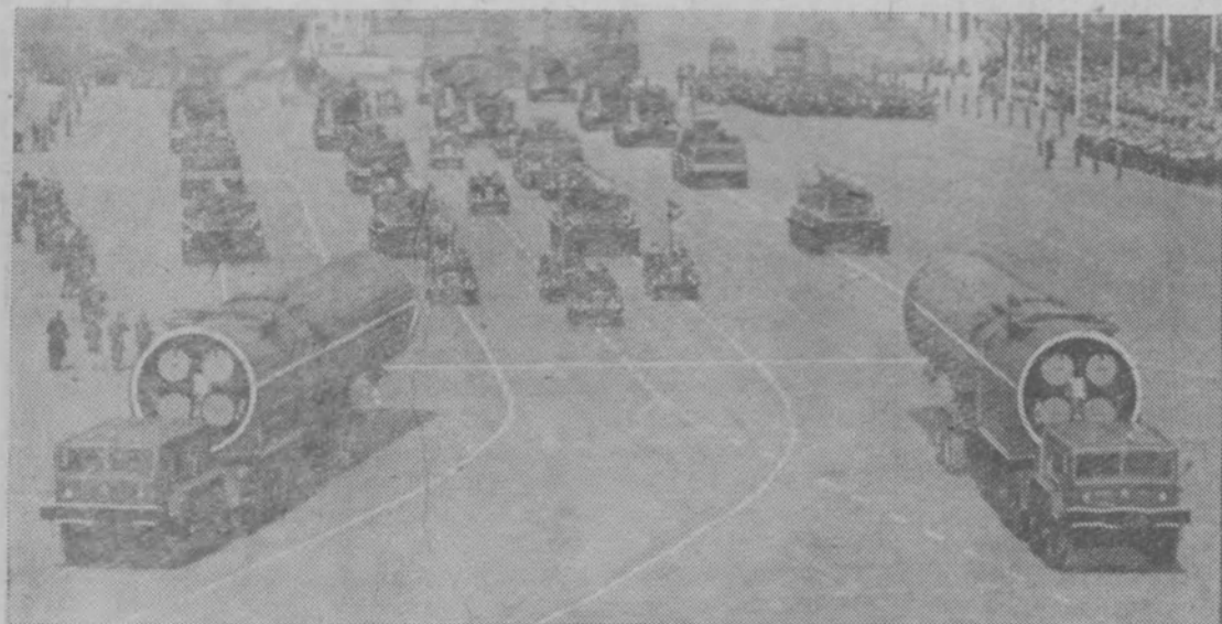
Празднование 1-го Мая в Москве. Парад войск Московского гарнизона на Красной площади. Проходит ракетная техника.