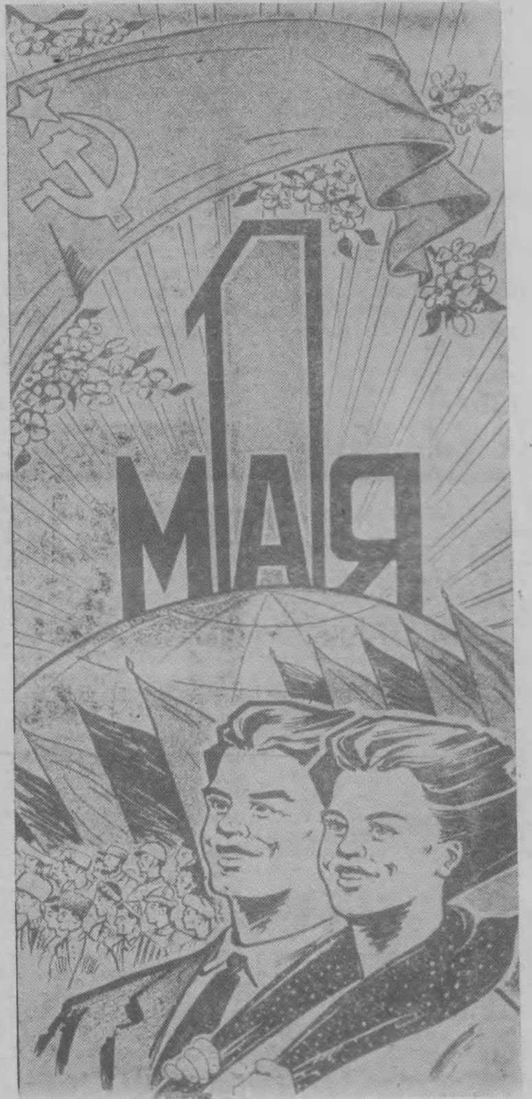
Плакат художника Ю. Иванова.

ХЛЕБОРОБЫ, ШИРОКИМ ФРОНТОМ РАЗВЕРНЕМ ПОЛЕВЫЕ РАБОТЫ! ДНЕМ РАНЬШЕ ПОСЕЕМ — НЕ ДЕЛЕЙ РАНЬШЕ ПОЖНЕМ!