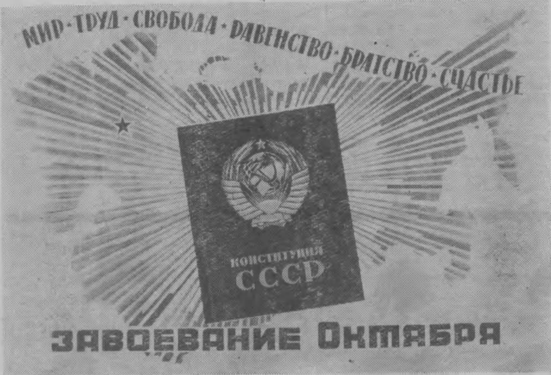
Плакат художника В. Викторова.

Год издания XXX № 144 1967 год (3262) ВТОРНИК 5 ДЕКАБРЯ Цена 2 коп.