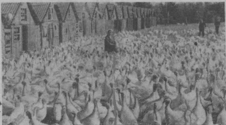
Киргизская ССР. Совхоз имени Карла Маркса Кантского района славится индюшиными фермами, где содержатся свыше ста тысяч индеек высокопродуктивных пород.

В юбилейном году птицеводы сдали государству 2,2 тысячи центнеров диетического мяса.