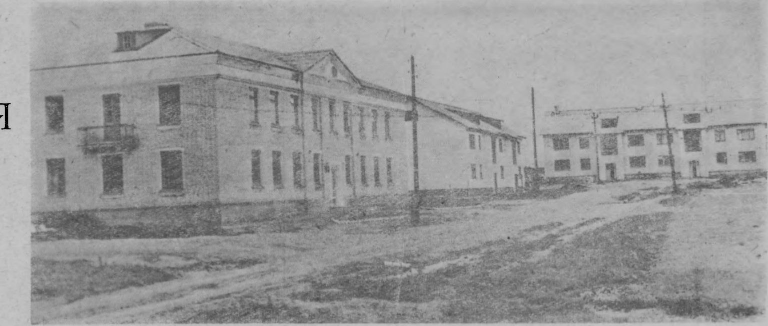
Новые дома на площади Мира села Тоншаево.

кисти перечеркнуто все, сказанное выше. Преобразился район.