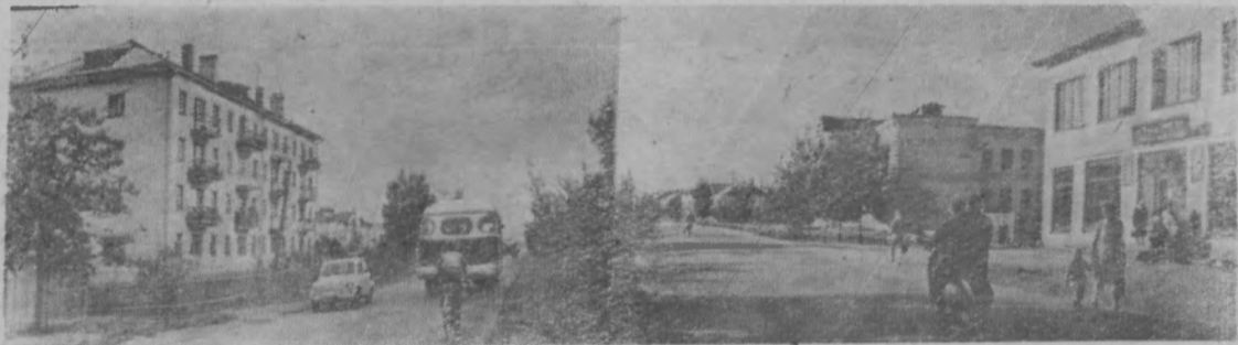
На улицах города Шахунья.

Стремительно поступь наших дней, обновляются, преобразуются не только город и рабочие поселки. Чудесные превращения можно увидеть и в деревне.