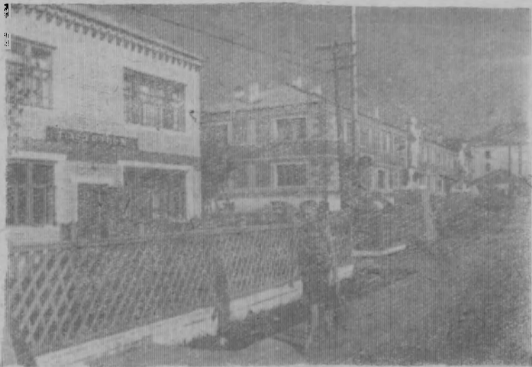
Пос. Вахтан. На одной из улиц.

1926 год. Началось опробование аппаратуры. 1 октября 1927 года—каучуконо-экстракционный завод вступил в строй действующих. Сейчас завод дает дополнительную продукцию—укусно-кальциевый порошок.