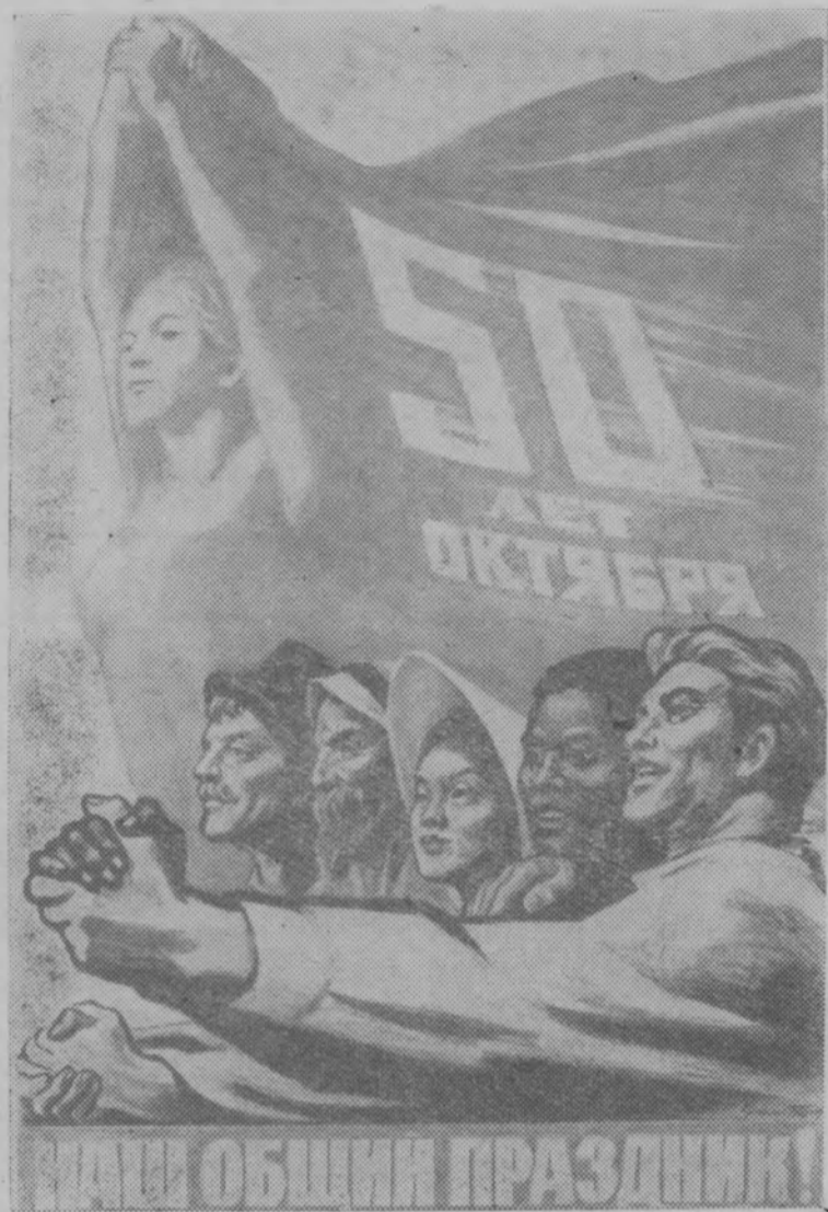
Плакат художника И. Тоидзе, выпущенный издательством «Советский художник» к 50-летию Великого Октября.