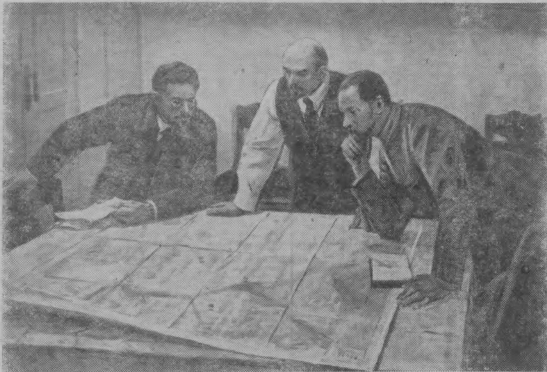
Москва. В Центральном выставочном зале открыта третья республиканская художественная выставка «Советская Россия». На снимке: работа художника В. В. Шименова «Перед штурмом».