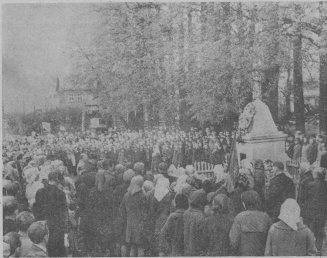
На снимке: митинг трудящихся района в день памяти А. З. Храмцова.