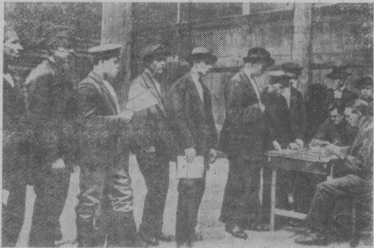
Запись рабочих в Красную Армию в Москве весной 1918 года.