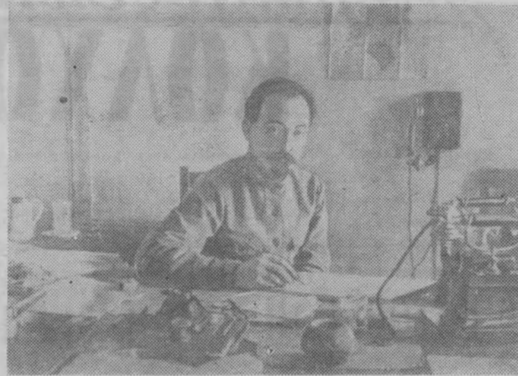
11 сентября исполняется 90 лет со дня рождения (1877) выдающегося деятеля Коммунистической партии и Советского государства Феликса Эдмундовича Дзержинского. Фотохроника ТАСС