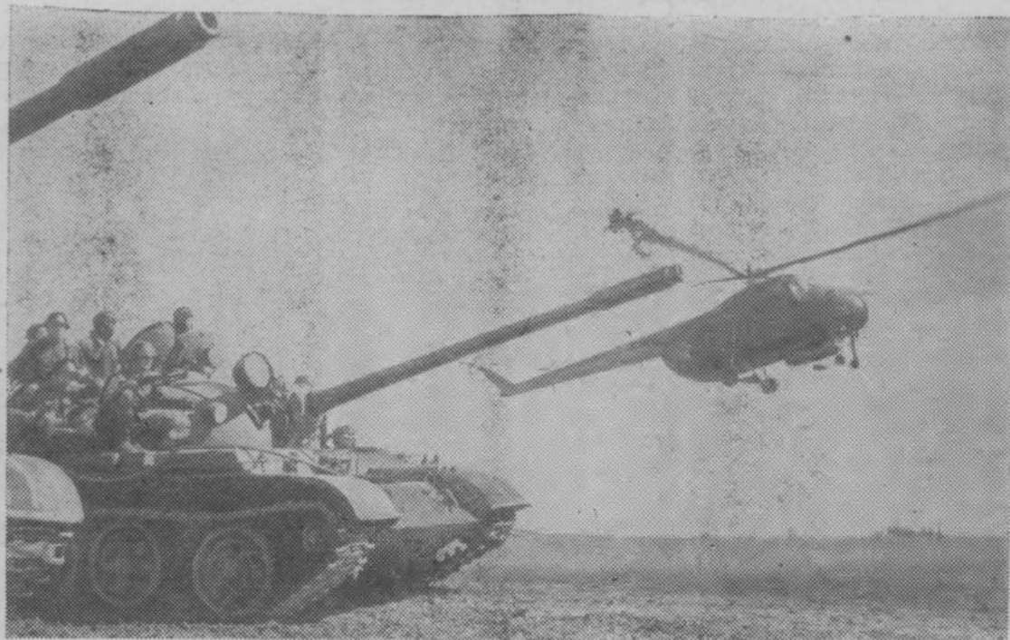
Танки с десантом идут в атаку