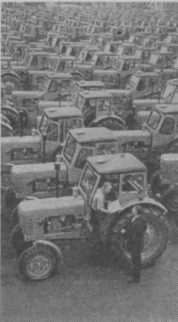
Материалы подготовлены Пресс-бюро «Правды»

Машины с маркой «Беларусь» завоевали большую популярность.