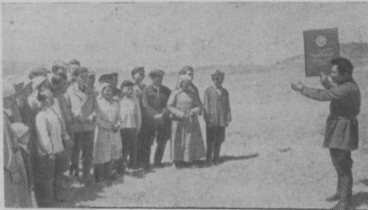
1937 год. Бурят-Монгольская АССР. Передача государственного акта колхозникам на вечное пользование земель.

1930 год. Установлен электродвигатель. Постро-