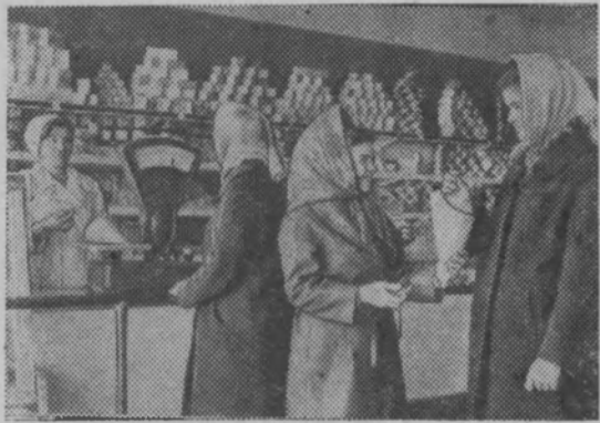
Расширяется сеть магазинов в селах. Построен новый магазин и в деревне Пушкари Ефремовского района Тульской области.

На снимке: в новом магазине.