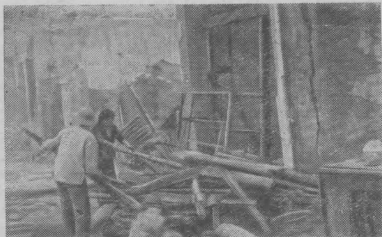
Ханой после варварского налета американских стер-