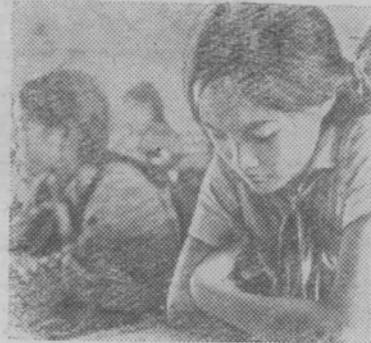
На уроке в школе в деревне Дай Ким.

ВЬЕТНАМ! Уже несколько лет не сходит это слово со страниц газет, повторяется по радио, неизменно присутствует на телевизионных экранах. Имя далекой азиатской страны звучит сегодня как набат, призывающий людей к бдительности, к решительной борьбе за мир, против империалистических войн. Американская военщина ведет войну не только против Южного Вьетнама, но и против суверенного государства — Демократической Республики Вьетнам, которая сегодня отмечает свои двадцать два года.