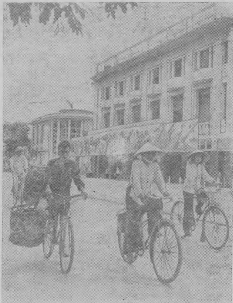
На снимке: на одной из улиц столицы ДРВ—Ханое.

2 сентября — провозглашение Демократической Республики Вьетнам (1945 г.)