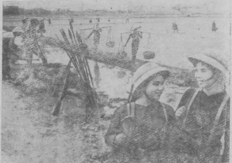
Весенние полевые работы в сельскохозяйственном ко-