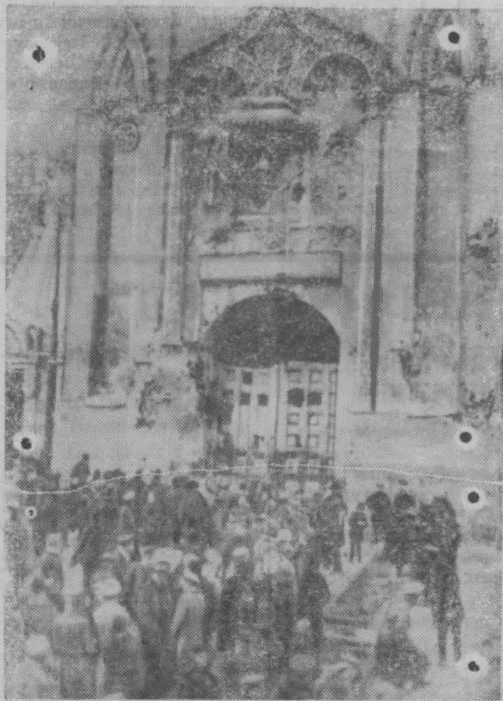
Ноябрь 1917 года. Кремль взят. У Никольских ворот. (Снимок из фондов Государственного музея революции СССР).

вших в гостинице «Метрополь». 2 ноября был опубликован Манифест Военно-Революционного Комитета Московского Совета «Ко всем гражданам Москвы». В нем говорилось: «После пятидневного кровавого боя враги народа, поднявшие руку против революции, разбиты наголову. Они сдались и обезоружены. Ценою крови мужественных борцов — солдат и рабочих была достигнута победа. В Москве отныне утверждается народная власть — власть Советов рабочих и солдатских депутатов».