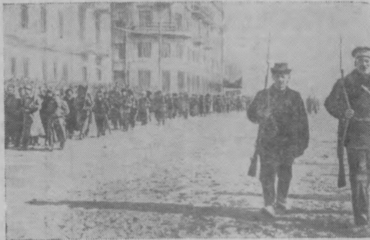
Чита. 1917 год. Красная гвардия.

Организовать Советскую власть в г. Иркутске, отстранив агентов Временного правительства Керенского и подчинив Советской власти все местные правительственные учреждения».