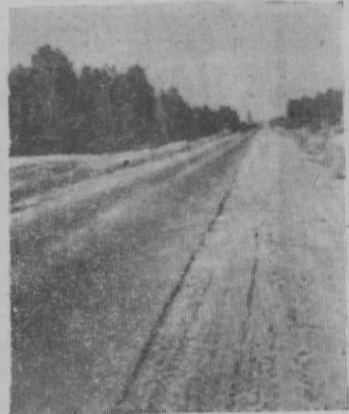
Дорога уходит вдаль.

Секретари партийных организаций, руководители предприятий, учреждений и колхозов должны взять под свой неослабный контроль, обратив особое внимание на распространение газет «Правда», «Горьковская правда» и партийных журналов. Газеты и журналы в каждую семью—такова задача партийных организаций.