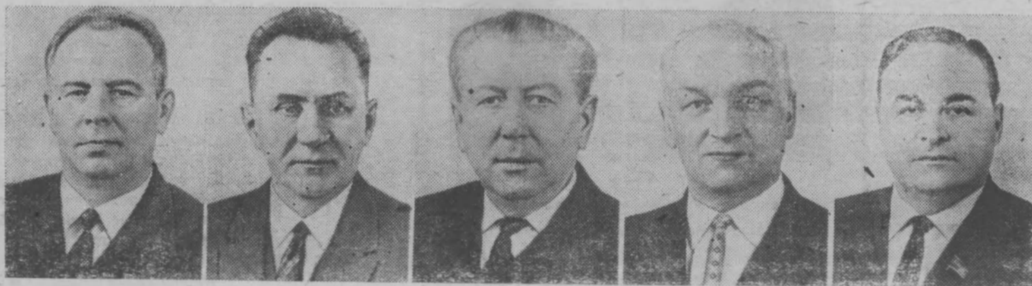
Н. В. Подгорный