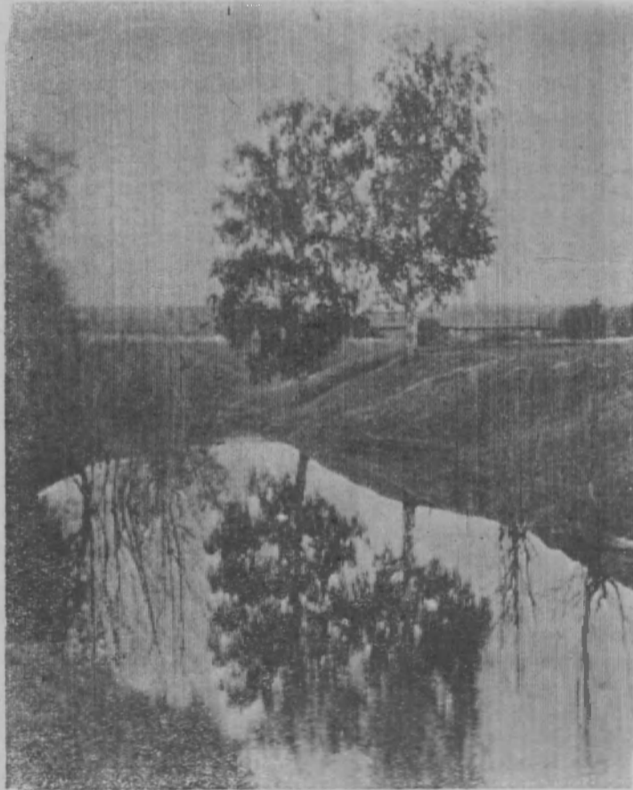
Стоит березка у ируда...