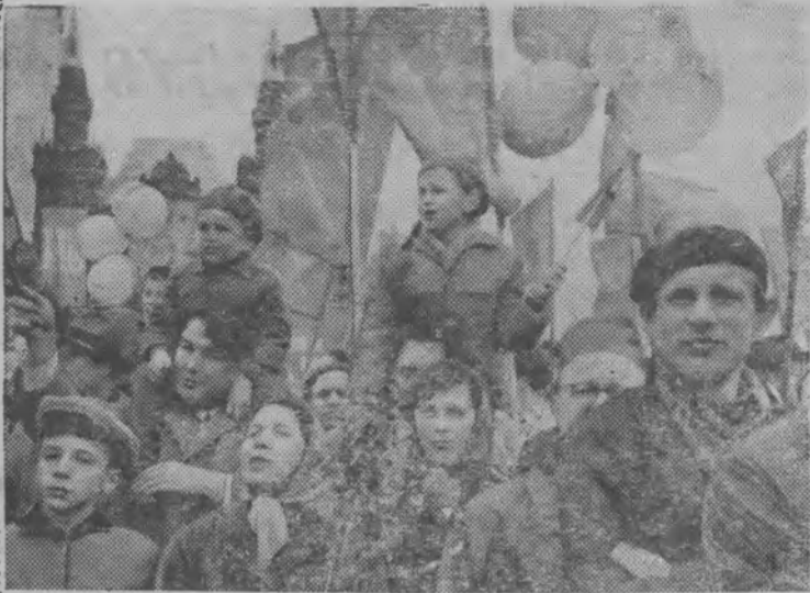
МОСКВА. Демонстрация представителей трудящихся на Красной площади.

Лесозаготовители, деревообработчики и лесохимики выдвинули кандидатом в депутаты Верховного Совета СССР тов. Харитона Ю. Б.