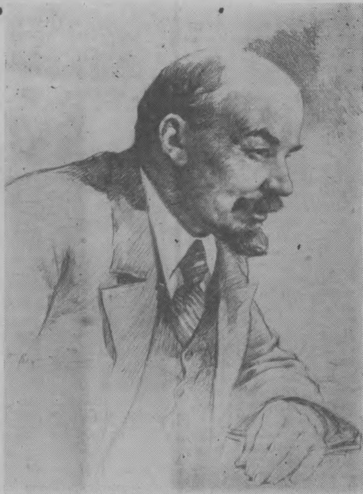
ВЛАДИМИР ИЛЬИЧ ЛЕНИН