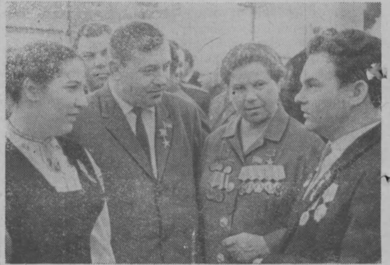
Москва. Кремлевский Дворец съездов. XXIII съезд Коммунистической партии Советского Союза.