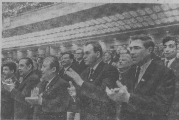
Москва. XXIII съезд Коммунистической партии Советского Союза.