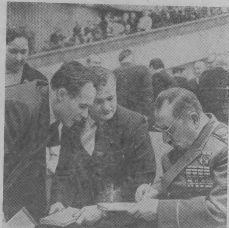
МОСКВА. Кремлевский Дворец съездов. XXIII съезд Коммунистической партии Советского Союза.

Место писателя в общественной жизни мы, советские литераторы, определяем как коммунисты, как сыновья нашей вели-