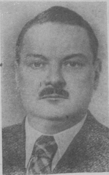
26 февраля исполняется 70 лет со дня рождения А. А. Жданова (1896—1948), выдающегося деятеля Коммунистической партии и Советского государства.