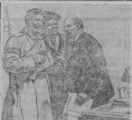
В. И. Ленин беседует с красногвардейцами в Смольном.