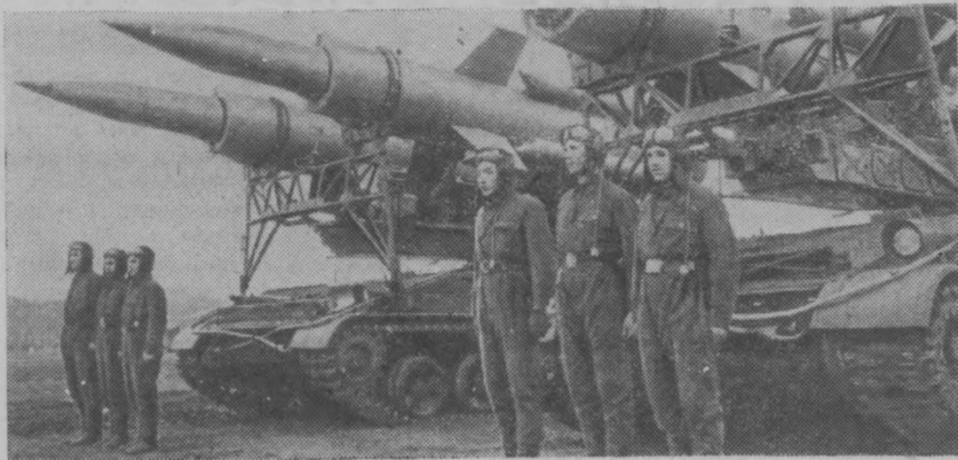
Воины-ракетчики слушают приказ командира перед маршем.