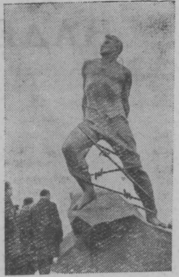
В Казани открыт памятник поэту-борцу, отважному сыну татарского народа, Герою Советского Союза Мусе Джалилю.

Авторы памятника—скульптор Владимир Цигаль и архитектор Лев Голубовский.