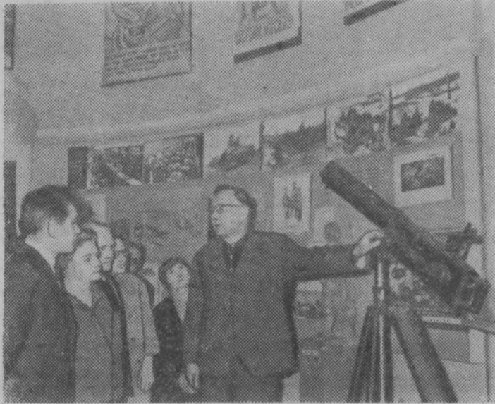
Москва. В Государственном историческом музее открылась выставка, посвященная 25-летию разгрома немецких фашистов под Москвой.